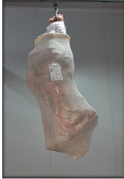
ETIQUETA SECUNDARIA - SECONDARY LABEL